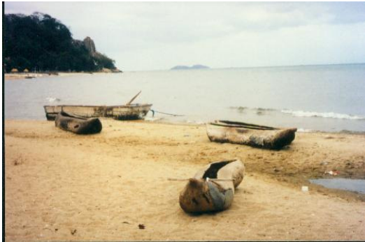
Dies war nicht unser Tauchboot!

Ich betitelte mich kurzerhand als „Instruktor“ (in Afrika geht das) und wir bekamen Equipment und die Bootsahrt zu den Tauchspots. Super. Tauchtiefe max. 20 m. Grund Fels und Sand, Bewuchs fehlte. Wassertemperatur (im August) ca. 23°C. Sicht ca. 20 m. Vor Flusspferden (Hippos) wurde gewarnt. Ich bin unter Wasser keinem begegnet! Das etwas salzig schmeckende Wasser erinnerte an das Tauchen im Meer. Auch durch die Größe des Sees und an den Sandstränden glaubte man sich an einem Ozean.