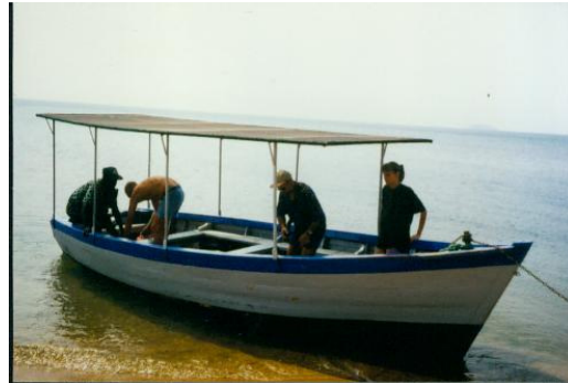
..... sondern das!!!