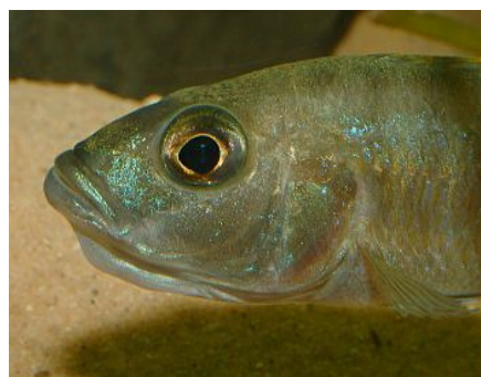
Man konnte die Maulbrüter u.a. bei ihrer Brutpflege beobachten